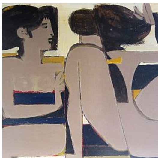
Seated Women, 1971

acrylique sur toile signée, titrée et datée "Y Moralis | seated women | 1971" en haut à droite 48 x 71 cm 54 x 77 cm (dimension du cadre)