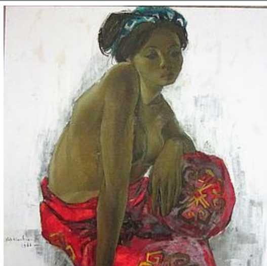
Jeune femme au tissu rouge, 1966