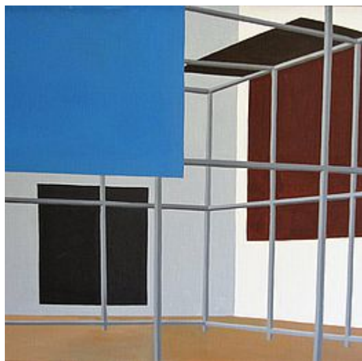
Kleines Gestell, 2007

huile sur toile, signée et datée "Thomas Huber | 2007" sur le châssis, 40 x 50 cm