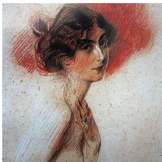
Jeune femme nue de profil

dessin au crayon noir, sanguine et rehauts de blanc