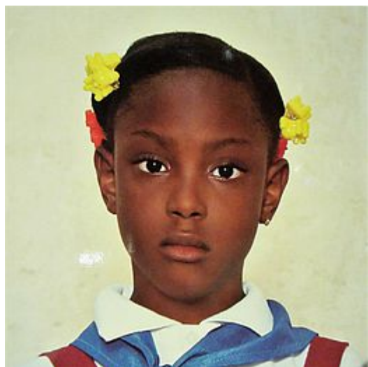
Escuela Julio Mella (School Girl), 2002